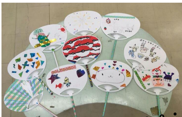
夏休み活動で作りました。

食生活等改善推進委員とは・・・「私たちの健康は私たちの手で」をスローガンに、食育を中心とした健康づくりのボランティア活動を行っている全国的な団体です。