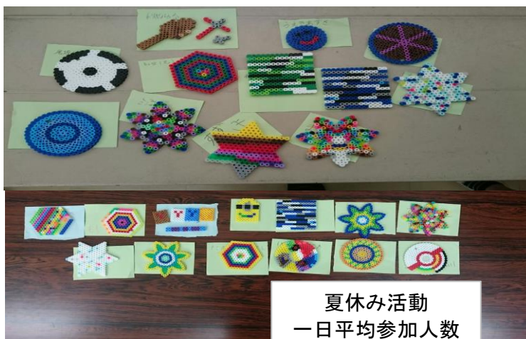
夏休み活動 一日平均参加人数 約63名

※ 学校の予定は、変更になる場合があります。「学校だより」・「学年だより」でご確認ください。