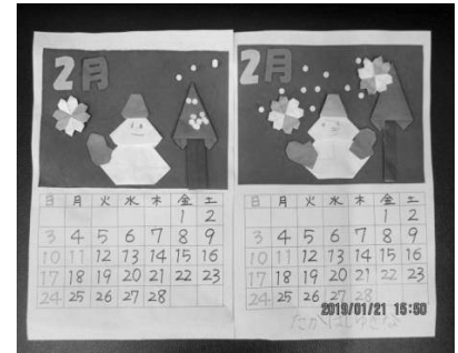
《2月のカレンダー:ゆき》