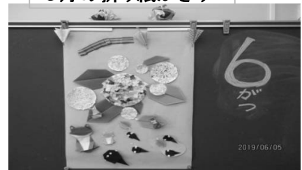
6月の折り紙かざり

学校のさまざまな行事で、学校生活に慣れ、おともだちもたくさんできたようです。梅雨のこの時期、疲れがでやすいようです。規則正しい生活を心がけましょう。汗のかく時期となりました。ハンカチ・タオルなど持たせてください。