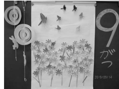
9月飾り:とんぼ、コスモス、月とうさぎ

さわやかな風に、いよいよ秋の訪れを感じます。 過ごしやすくなってきたこともあり、伸び伸びと身体を動かすことを、楽しんでいるこどもたち。 まだまだ、汗だくです。ハンカチ、汗ふきタオルをご用意ください。持ち物には、名前をお書きください。