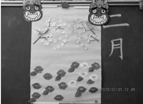
折り紙『ツバキ・梅・うぐいす』